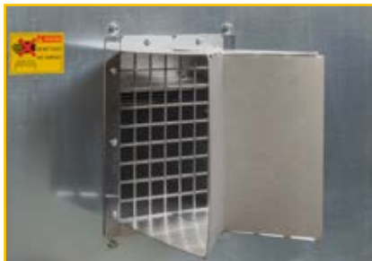
Luftverteiler (bestehend aus einem rechten und einem linken Teil)