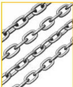
Aufhängeketten für die Montage im Innenbereich