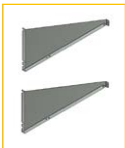
Tragarme für die Montage im Innenbereich