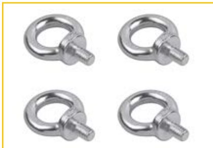
4 Ringschrauben zum Aufhängen