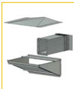
Zubehör für die Montage im Außenbereich